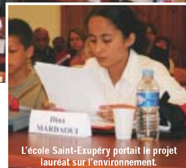
L'école Saint-Exupéry portait le projet lauréat sur l'environnement.