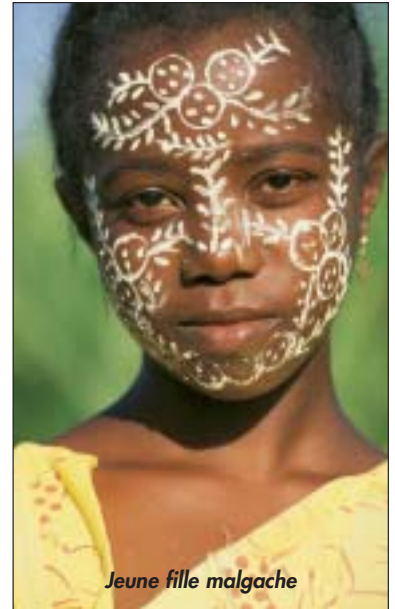
Jeune fille malgache

Une partie des colis sera acheminée par avion à la fin du mois par les bénévoles de l'ASAEM. Le reste sera convoyé par bateau à la fin de l'hiver, en même temps que du matériel