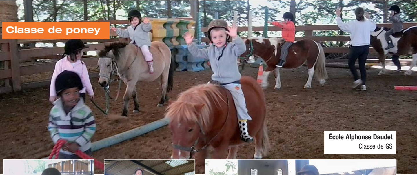
École Alphonse Daudet Classe de GS