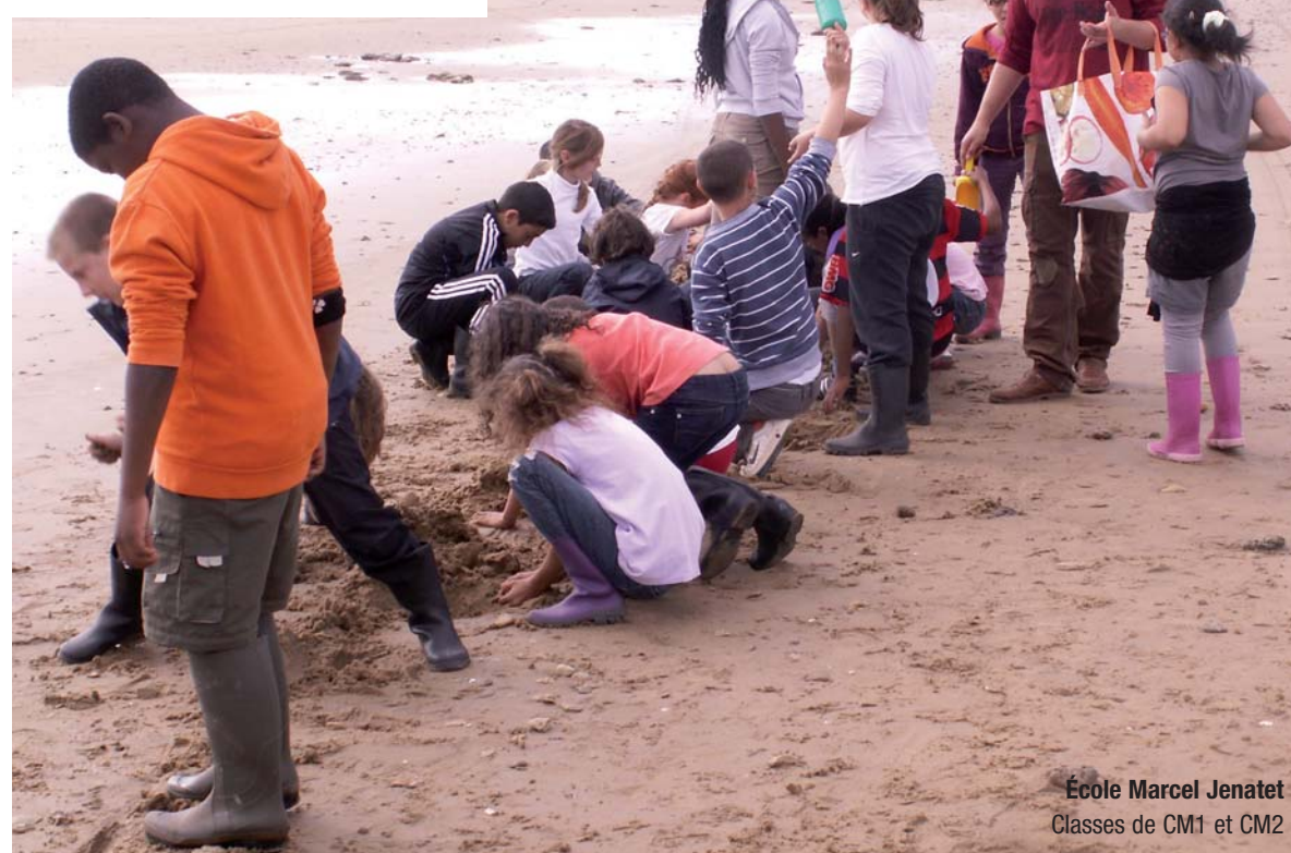
École Marcel Jenatet Classes de CM1 et CM2